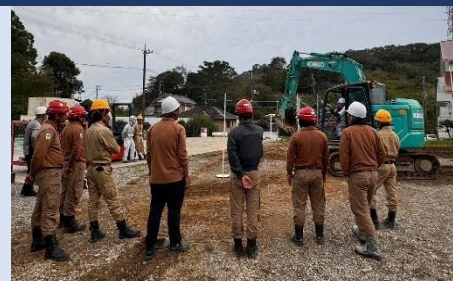
車両系建設機械(整地等)