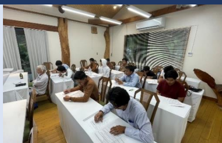
小型移動式クレーン運転