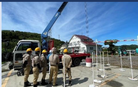
フォークリフト運転