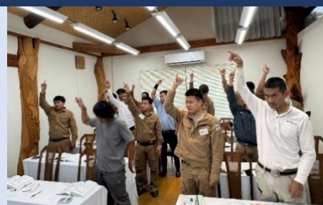
車両系建設機械(整地等)